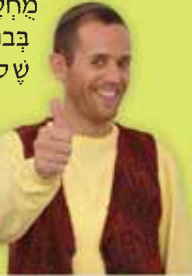
שבת שלום, טוביה

בפרשת השבוע פרשת יתרו, אנוח מגיעים למעמד הר סיני. כל עם ישראל עמד מסביב להר סיני ושמע את עשרת הדברות. במשך אלפי שנים עברה המסורת מאב לבן, וכלנו יודעים שהקדוש-ברוך-הוא בכבודו ובעצמו דבר אלינו! כל העולם עצר ושתק, ואנחנו הקשבנו ושמענו את עשרת הדברות. עשרת הדברות הן הבסיס של האמונה שלנו, הבסיס של ההתנהגות שלנו בין אדם למקום ובין אדם לחברו. אמונה מחלטת בברא עולם, רק בברא עולם! בלי שתוף של עבודה זרה חס וחלילה. שמירת שבת, כבוד הורים, ולא לעשות כע לאף אדם, בלי קנאה, בלי שנאה