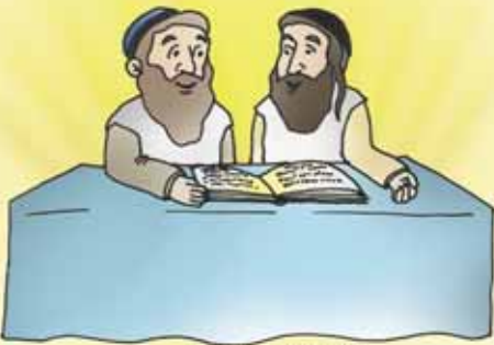
ציור: חגי בן הרוש

(מתוך הספר: "לשמוע את דברי ה' מפי הרב ניר בן ארצי שליט"א)