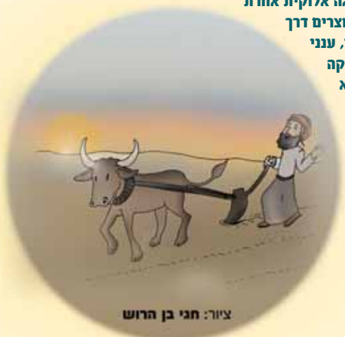
ציור: חגי בן הרוש

(מתוך הספר: "לשמע את דברי ה' מפי הרב ניר בן ארצי שליט"א)