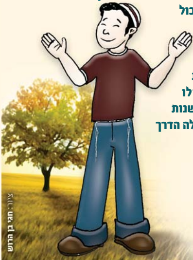
חולט א, זא: לור: ציור

(מתוך הספר: "פי צדיק") מפי הרב ניר בן ארצי שליט"א