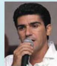
מייק קרוצי' ותזמורתו