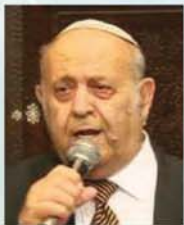
יגאל בן חיים הוותיק וגדול החזנות והפיוט בעולם

תזמורת אנדלוסית עם גדולי הזמרים והפייטנים