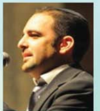
משה לוק ותזמורתו