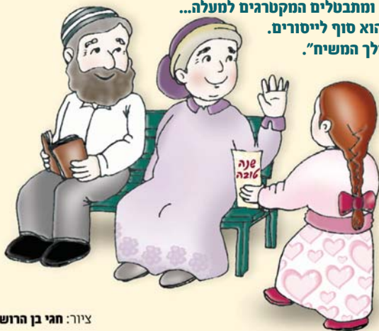
ציור: חגי בן הרוש

(מתוך הספר: "פי צדיק") מפי הרב ניר בן ארצי שליט"א