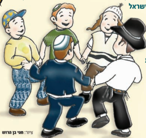
ציור: חגי בן הרוש

יש לשלוח לפקס: 08-6895560 או בדואר אלקטרוני irneri@gmail.com