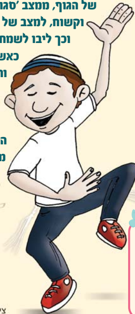
ציור: חגי בן הרוש

(מתוך הספר: "פי צדיק" מפי הרב ניר בן ארצי שליט"א)