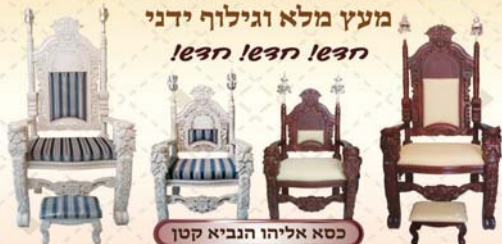
כסא אליהו הנביא קטן