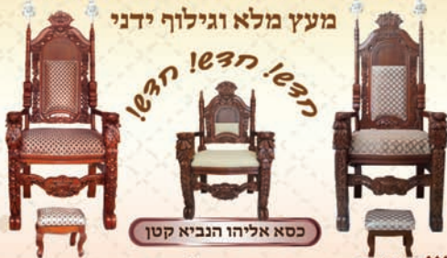
כסא אליהו הנביא קטן