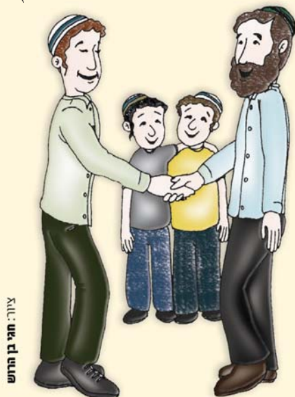
ציור: חגי בן הרש

והזכרה מהפעם הקודמת: אליה שרעבי - אלון מורה