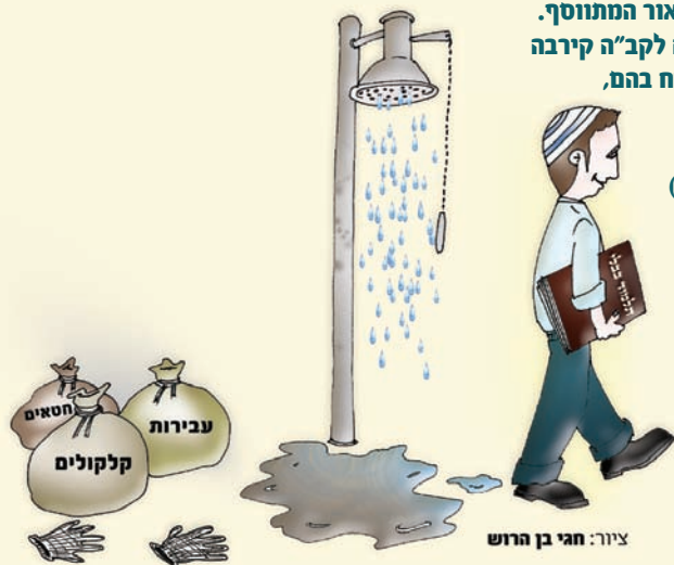
ציור: חגי בן הרוש

(מתוך הספר: "פי צדיק" מפי הרב ניר בן ארצי שליט"א)