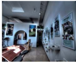
ספרי תורה תפילין מזוזות חנות יודאיקה