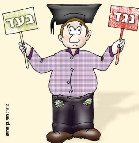
צויר: חמי בו הרדוש