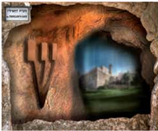
מרכז מבקרים ומערת התפילין

סופרי סת"ם מומחים ויראי שמיים תושבי חברון | הכנסת פרשיות עם נער הבר מצווה וסיור למשפחה במערת המכפלה ובאתרי חברון העתיקה | בלעדי! מזוזות חברון מהודרת ומרשימה | מזוזות וספרי תורה ברמות הידור שונות | מחירים ותשלומים נוחים.