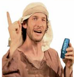
בואו לפגוש את עשהאל