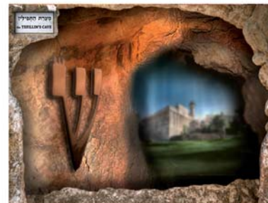
מרכז מבקרים ומערת התפילין