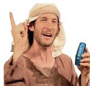
בואו לפגוש את עשהאל

073-2211116 02-5823823 | פארק התעשייה קרית ארבע | www.tefillinhebron.com