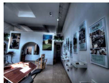
ספרי תורה תפילין גזוזות חנות יודאיקה