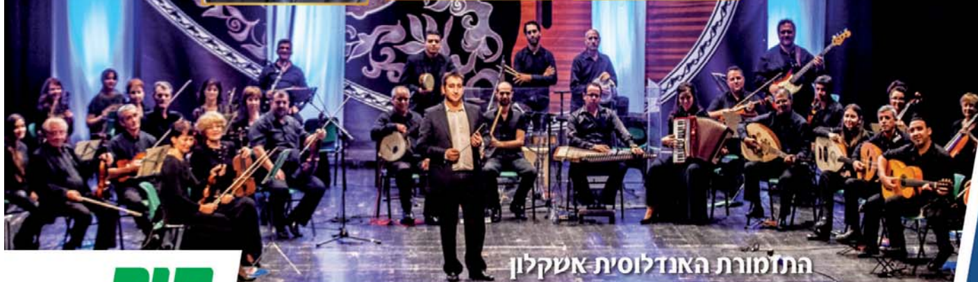
התזמורת האנדלוסית אשקלון