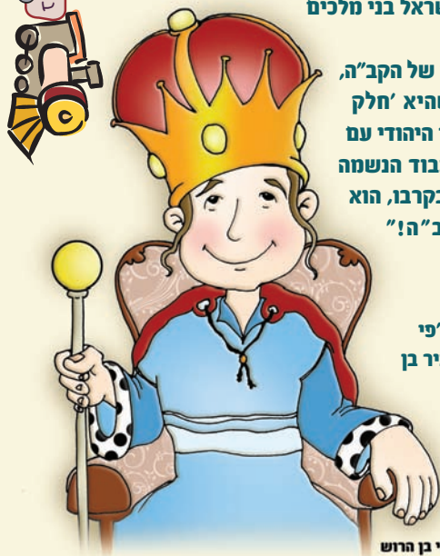
ציור: חגי בן הרוש