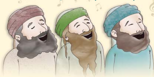
ציור: חגי בן הרוש

(מתוך הספר: "פי צדיק" מפי הרב ניר בן ארצי שליט"א)