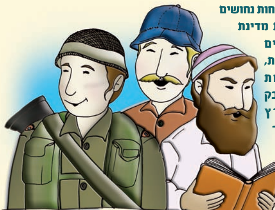
ציור: חגי בן הרוש

(מתוך הספר: "פי עדיק" מפי הרב ניר בן ארצי שליט"א)