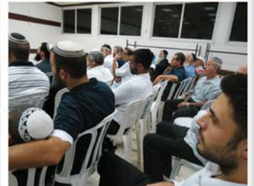
הכנס שהתקיים במושב רינתיה בביה"כ המרכזי ביישוב, ביום רביעי ט"ו חשוון תשע"ג (31.10)